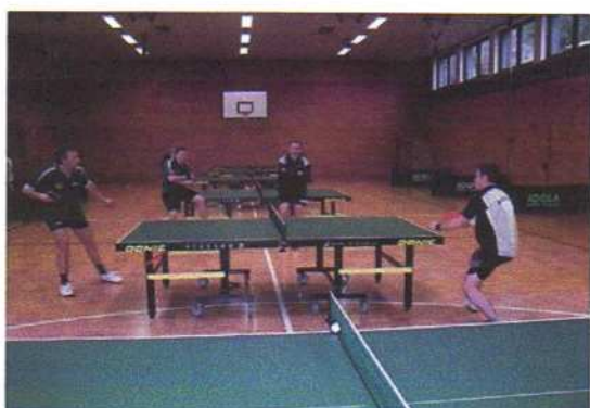
Finale Ecker - Karer