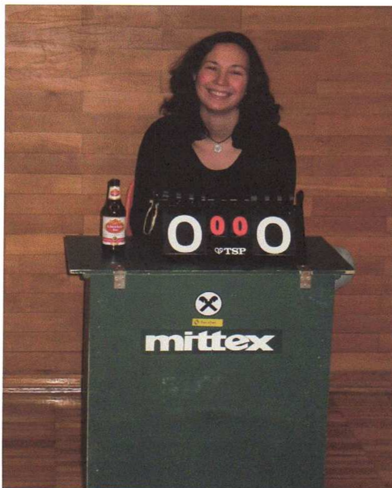
Eine echte Ramingtaler Schiedsrichterin