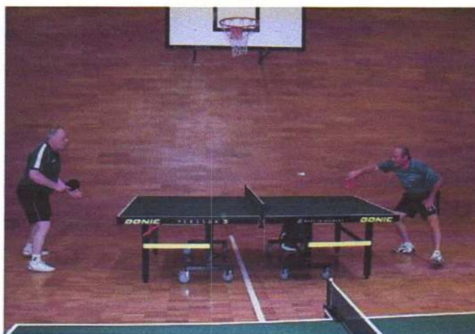
Bewerb der Schwergewichtsklasse