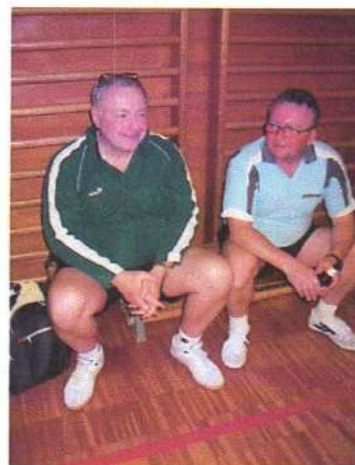
Da wiast ja miad!