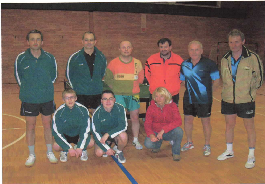
Unsere Cupmannschaft mit den Gegnern aus Steyrermühl

Mit dem Erreichen der 3. Hauptrunde (Semifinale) konnte unsere A-Mannschaft den ausgezeichneten 3. Rang im OÖ. UNIQA-Cup belegen. Insgesamt schon das 3. Mal.