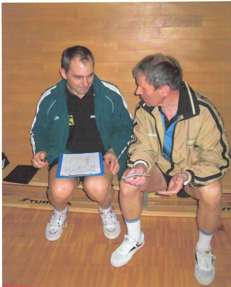
Aufstellung der Mannschaften zum Cupspiel gegen ASKÖ Steyrermühl