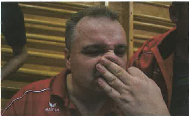
Irgendwas beißt da