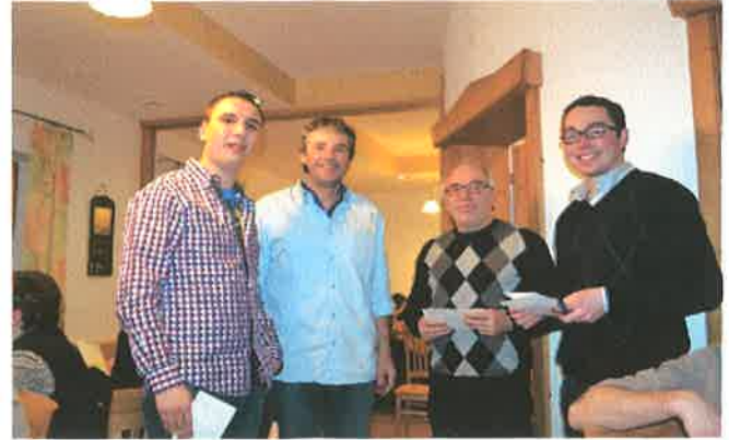
Siegerscheck für die Doppelgewinner