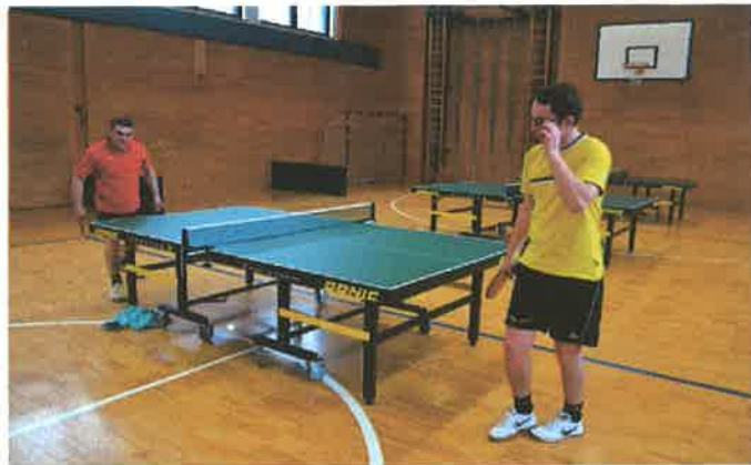
Wo ist den nur der Ball?