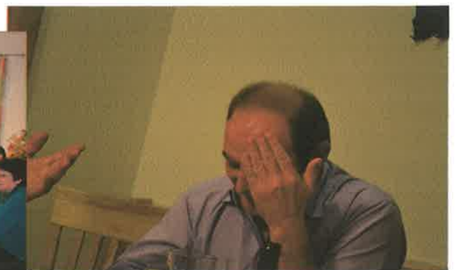
Wer wird des wieda zoin? Wos des kost